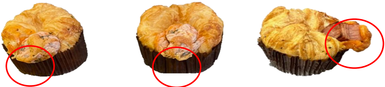
ใ้เส้นออกมาเกินเส้นค้ำเกิน 1 ซม. จากขอบถ้วย