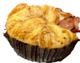
ใ้ระเบิดออกนอกเส้นค้ำ