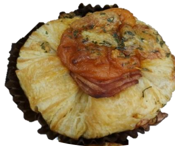
ไส้ไม่อยู่ตรงกลาง