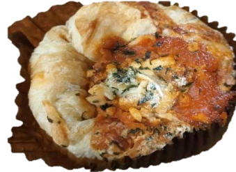
กระทงอ้า